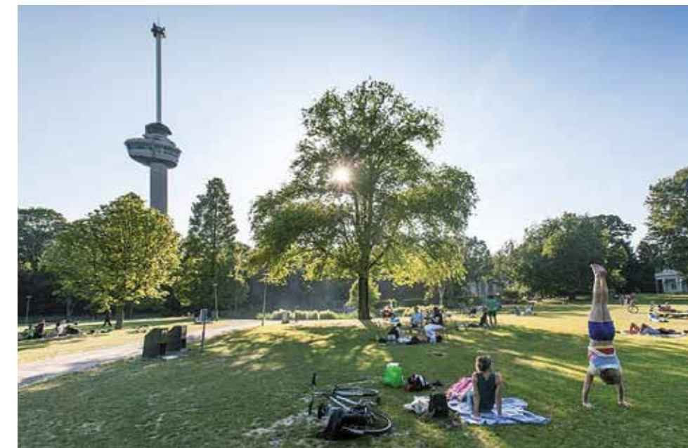
Het Park, Rotterdam.

Een andere wens voor Het Park is de terugkeer van een zorgzame parkwacht: 'Het liefst een leuk, enthousiast persoon, een gastheer of gastvrouw, initiatiefrijk en op een leuke manier de ogen en oren van Het Park. Wanneer je bij zo iemand 'op bezoek' gaat laat je geen rommel achter en gedraag je je sociaal. In New York heb ik gezien dat er stoeltjes in de parken staan die je naar eigen wens kunt pakken en verplaatsen, net als in de tuinen van het Rijksmuseum.' Parken behoren tot de meest democratische, geliefde en gewaardeerde vormen van publieke ruimte. En overal geldt dat parken rust bieden, verkeerslawaai dempen, de stad koelen en ook nog eens overtollig regenwater opvangen. Iedereen houdt van parken en steden moeten vergroenen. Bestuurders zeggen dat en bewoners willen dat. Alle seinen dus op groen want het park is het sieraad van de stad.