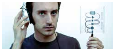
8 60 dansers en 50 violisten Big Idea in Onderzeebootloods