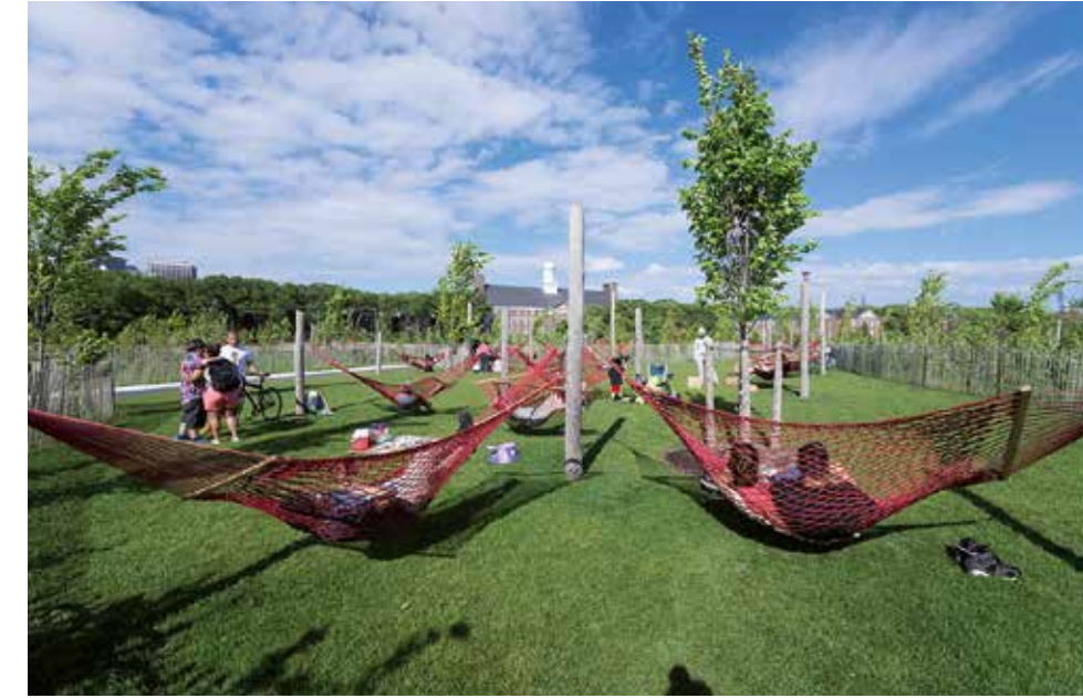
Governors Island, New York.