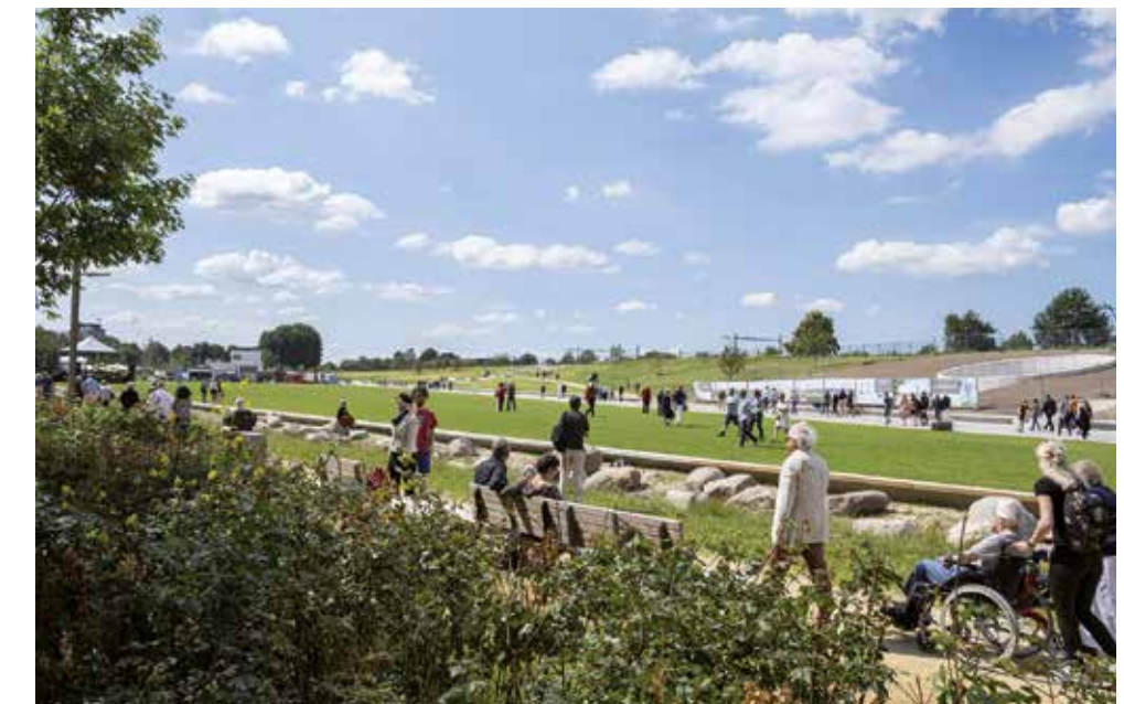
Spoorpark Tilburg.