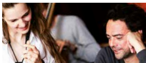
6 Het Batavierhuis Nieuw huis vol muzikaal talent