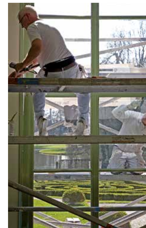
Restauratie Het Heerenhuys in Het Park, Rotterdam