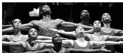
2 Alvin Ailey in Rotterdam! Een must voor dansliefhebbers

'al het gene dat tot het culturele enige betrekking heeft'