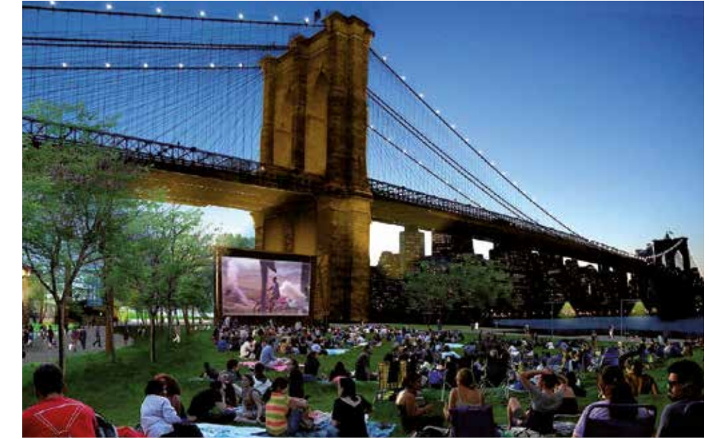
Brooklyn Bridge Park, New York

Deze zomer opende het grootste burgerinitiatief van ons land, het Spoorpark in Tilburg. Waar burgers en bestuurders elkaar vinden wordt het resultaat beter. Of, zoals bij de opening werd gememoreerd omdat 'de gemeenteraad op zijn handen moest gaan zitten en de wethouder ook, het park er beter en mooier van is geworden.'