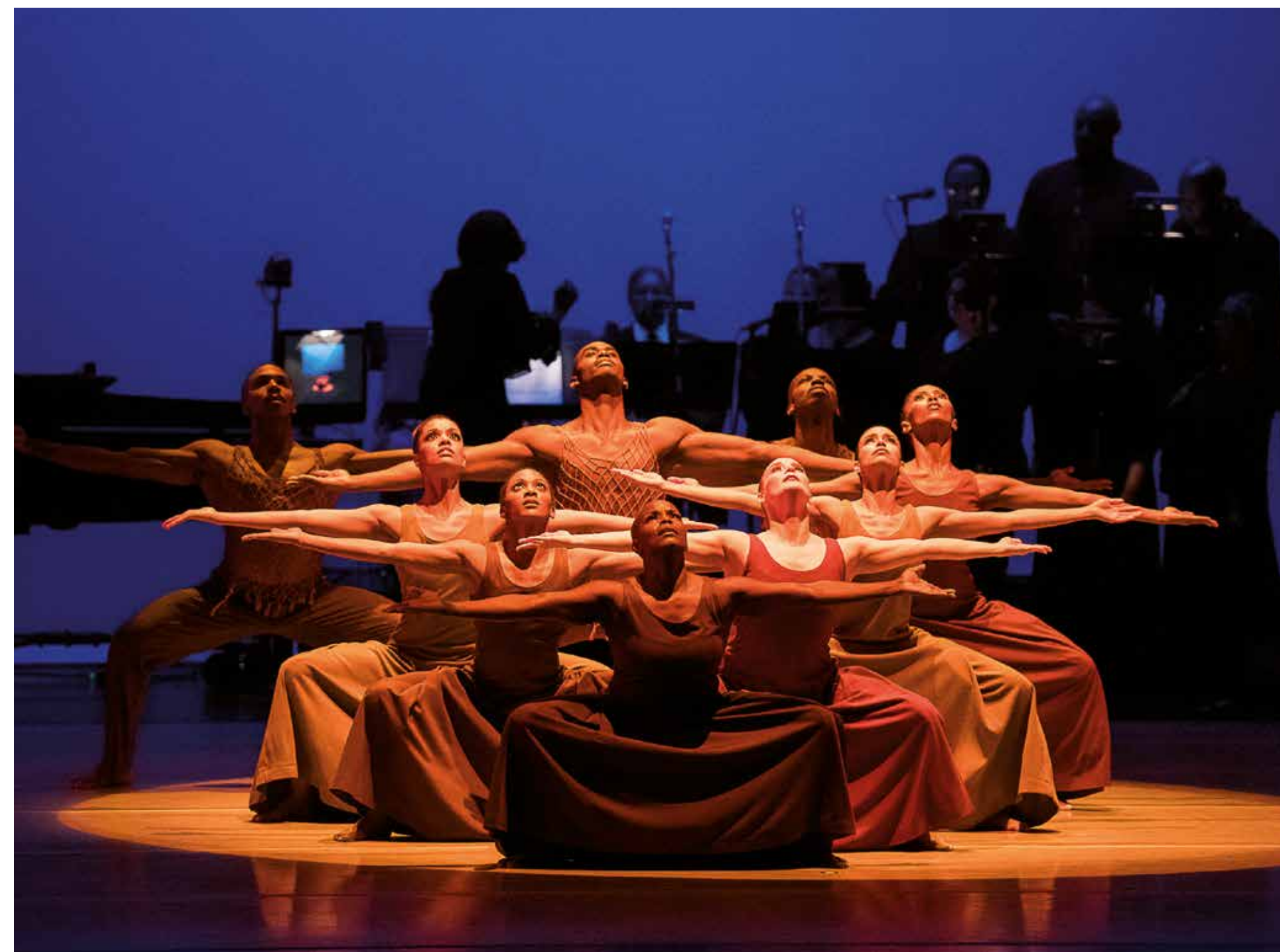
Alvin Ailey's Revelations.

'Dat zit ingebakken in mijn functie als directeur van Holland Dance Festival. Het is mijn opdracht om dansvoorstellingen naar Nederland te halen die hier zelden of nooit te zien zijn. Ik ben altijd onderweg, altijd op zoek, altijd aan het kijken. Het is niet dat ik twee maanden per jaar nieuwe voorstellingen scout en