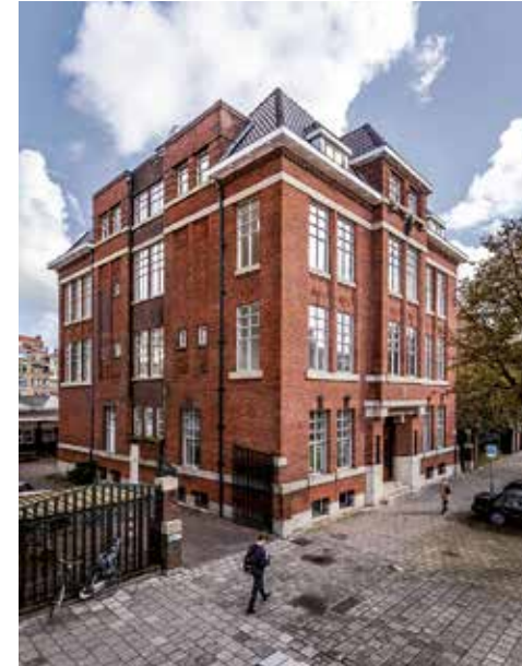
Batavierhuis, Pieter de Hoochweg 108, Rotterdam

Andere voorwaarden: kandidaat-gebruikers moeten in de muzieksector werken, wonen in Rotterdam en willen innoveren. Op eigen kracht: ‘De Batavieren zelf vormen het Batavierhuis.’ Van de zestig mensen die gebruik mogen gaan maken van de ruimten hebben we nu 31 muzikanten en 16