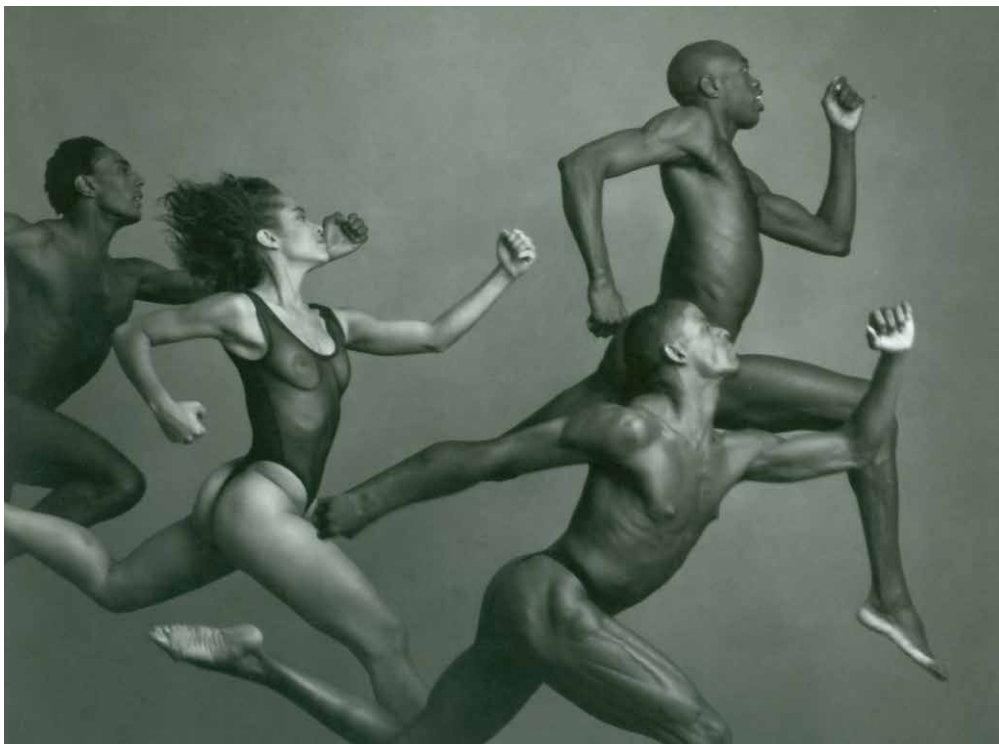
Alvin Ailey American Dance Theater, 1995.