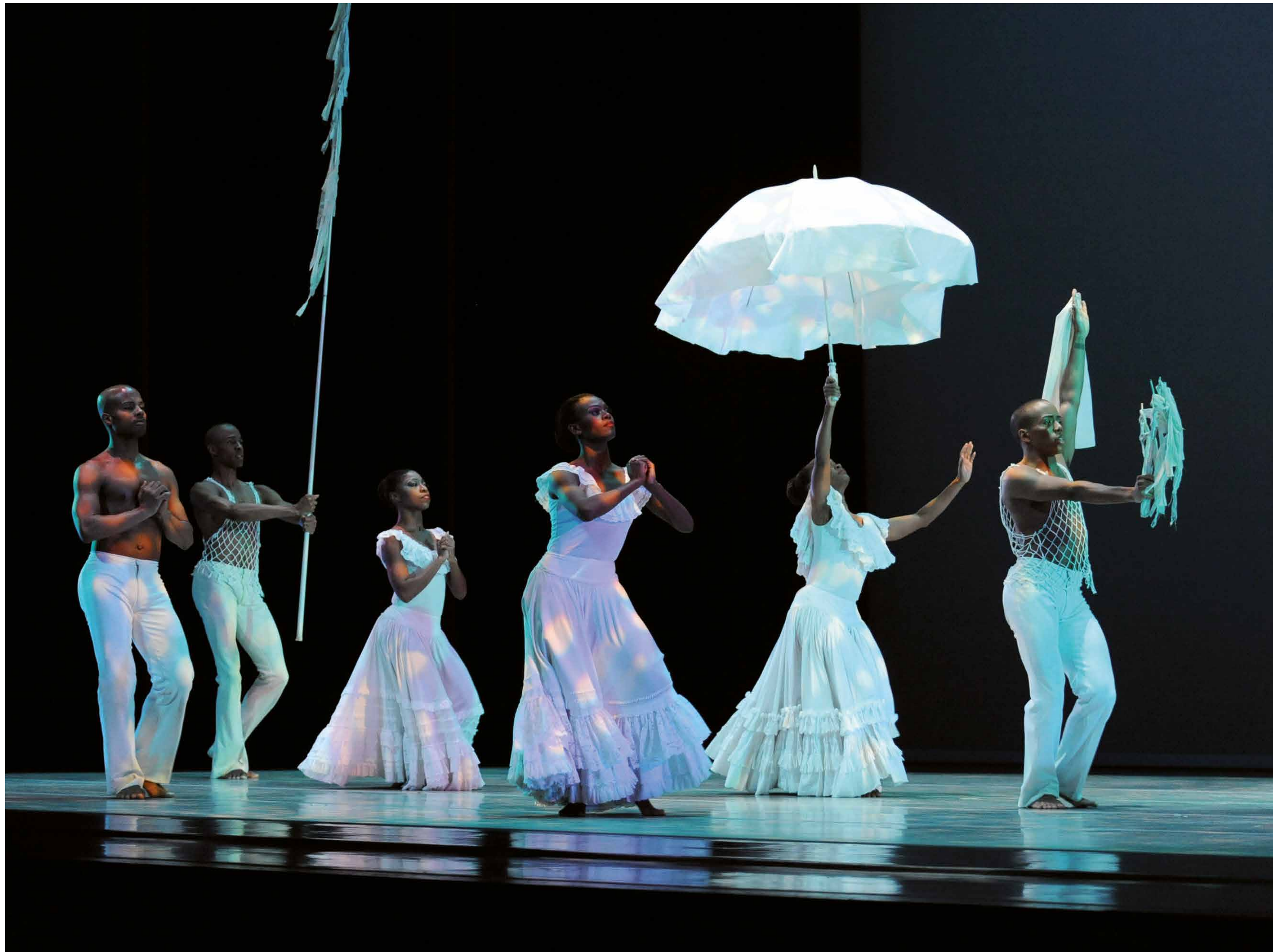
Alvin Ailey's Revelations, 2011