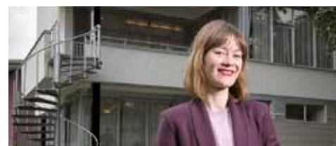
10 Open Monumentendag Plekken van Plezier voor iedereen