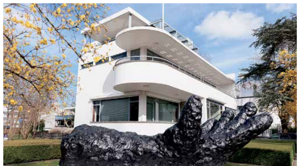
Het Chabot Museum is een icoon van het Nieuwe Bouwen, gelegen in het Rotterdamse Museumpark.

Nederlands Fotomuseum Wilhelminakade 332 | Rotterdam www.nederlandsfotomuseum.nl