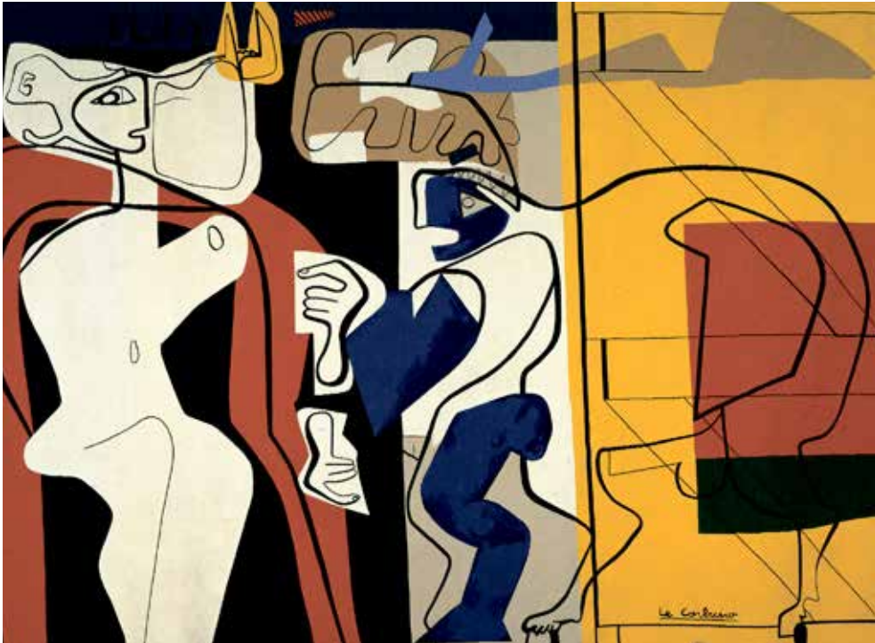
Le Corbusier (1887-1965), The Woman and the Blacksmith, 1967, Manufacture de Beauvais, 217 x 362 cm, wool. Collection Mobilier national.