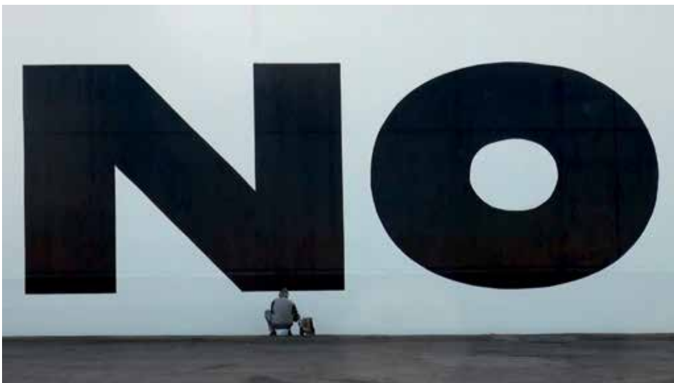
Paulien Oltheten, Meanwhile I'm doing exercise, audiovisueel werk bestaande uit 25 videofragmenten en 100 foto's, 22min35s, 2017. Collectie Nederlands Fotomuseum

Stedelijk Museum Schiedam Hoogstraat 112 | Schiedam www.stedelijkmuseumschiedam.nl