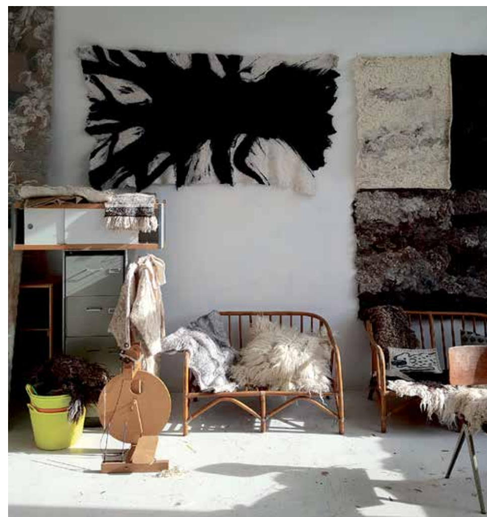
Atelier van Beatrice Waanders, Insulindestraat 1