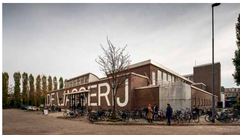
De Waterrij, broedplaats voor innovatieve mode en thuis voor 50 studio's en een makerslab

Alle uitgebreide interviews: dekunstbode.nl